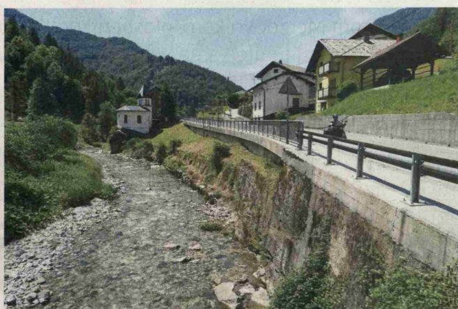
Hudajužna leži ob glavni cesti skozi Baško grapo. Čeprav njeno ime spominja na nekaj hudega, je njegov izvor povsem logičen.