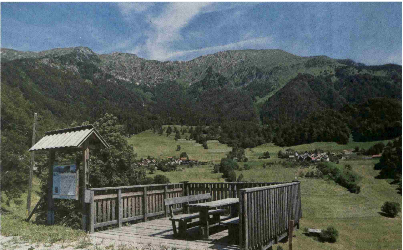
Pogled na vas Stržišče, ki se pokaže obiskovalcu z lepo urejene razgledne točke, od koder je pred nami celotno južno pobočje Črne prsti.